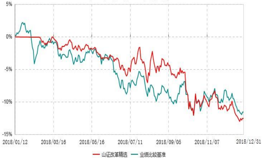
山西证券改革精选灵活配置混合型证券投资基金累计净值增长率与业绩比较基准收益率历史走势对比图 (2018年01月12日-2018年12月31日)

注：1、本基金基金合同生效日为2018年1月12日，至本报告期末，本基金运作时间未 满一年；